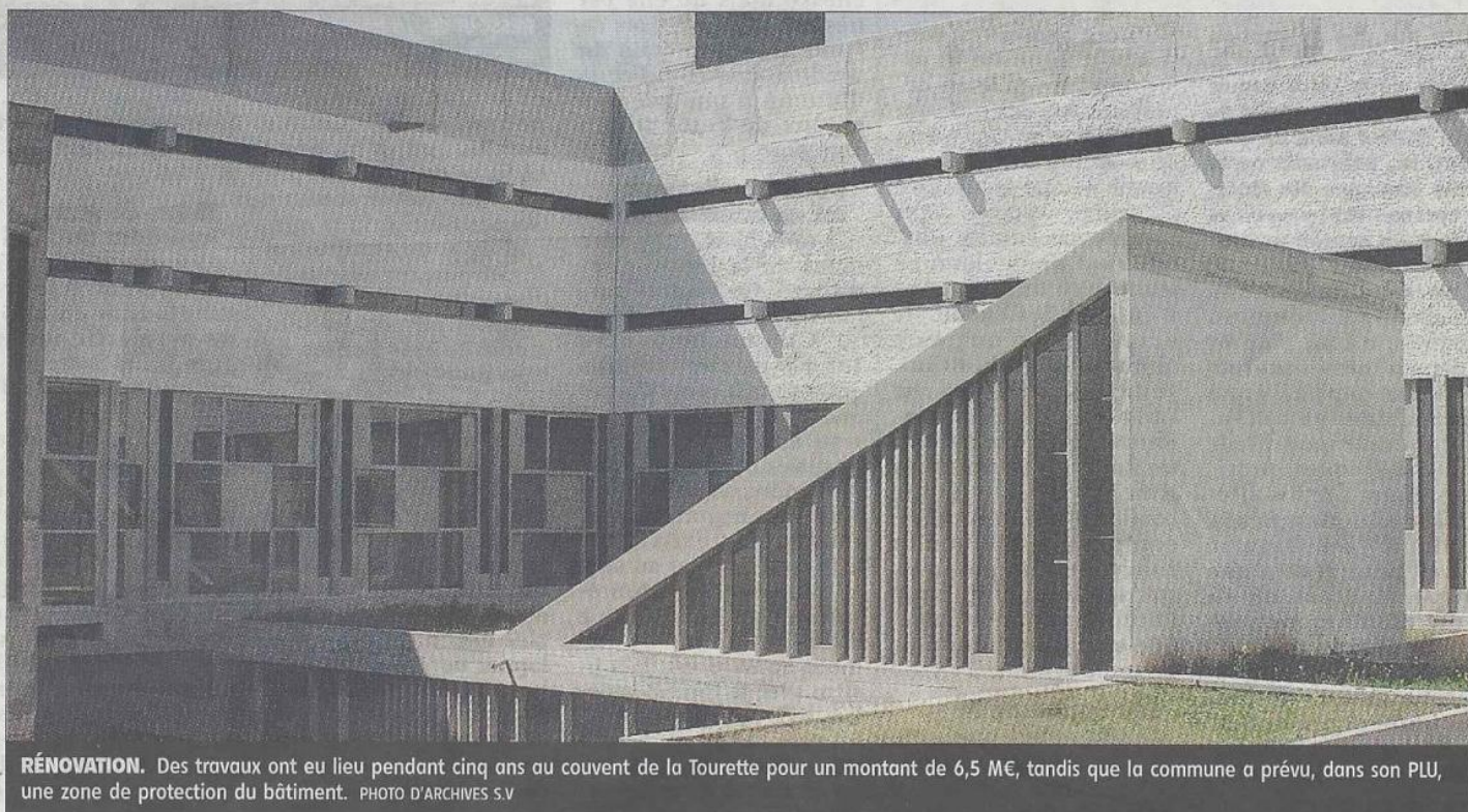
RÉNOVATION. Des travaux ont eu lieu pendant cinq ans au couvent de la Tourette pour un montant de 6,5 M€, tandis que la commune a prévu, dans son PLU, une zone de protection du bâtiment.

Si lors de la dernière présentation, seule l'association des sites de Le Corbusier avait porté le dossier, cette fois, il sera appuyé par la fondation et le ministère de la Culture. Changement de stratégie aussi avec une présentation qui prévoit la mise en place d'un itinéraire culturel européen des sites Le Corbusier. « Tout un parcours pour les spé-