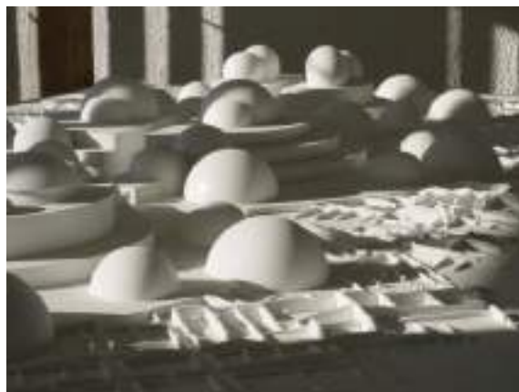
Amnésia, détail, 2008