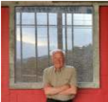
François Morellet (2009)

Le couvent de La Tourette est un lieu résolument ouvert sur le monde d'aujourd'hui et la création artistique contemporaine. Sont ainsi organisées depuis 2009 des expositions, qui sont autant de rencontres entre des artistes importants de notre époque et l'architecture du couvent. Cette articulation entre un lieu spirituel vivant, la qualité architecturale du couvent et la qualité artistique des œuvres choisies, fait de chaque exposition une expérience unique. Les œuvres ne sont plus exposées mais « habitent », pour un temps, dans une architecture majeure qui abrite une vie à la fois humaine, spirituelle, laborieuse et culturelle.