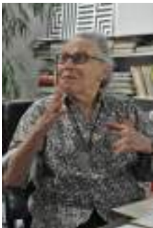
Vera Molnar (2010)