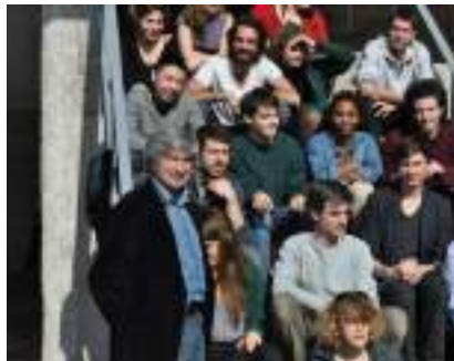
Giuseppe Penone et ses élèves (2012)