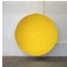
Sculpture d'Anish Kapoor

Né à Bombay en 1954, Anish Kapoor vit et travaille à Londres depuis 1972. Ses créations sont présentées dans les grands musées et les institutions internationales (le MoMA de New York, les musées Guggenheim de New York et Bilbao, la biennale de Venise).