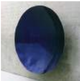
Sculpture d'Anish Kapoor