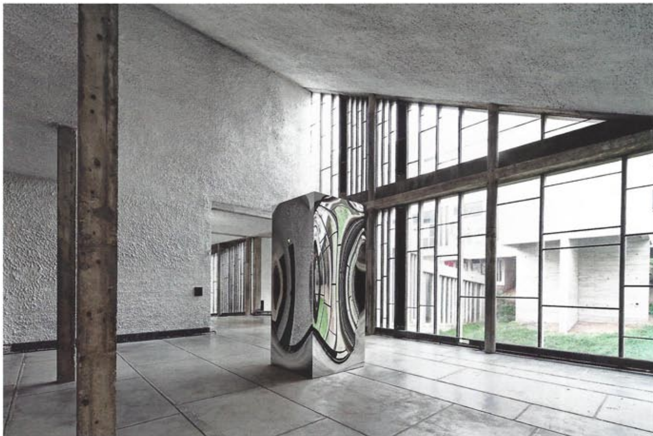
NON-OBJECT, TRABALHO DE ANISH KAPOOR, EXIBIDO NO CONVENTO DE LA TOURETTE

capela. O volume da capela é igual ao de todos os cem dormitórios, como se cada habitante do mosteiro tivesse também seu próprio espaço na igreja. Desde 2009, o convento, atualmente habitado por menos de dez monges, possui um programa de arte contemporânea, abrigando seus espaços para a inserção de trabalhos que dialogam com o edifício histórico de Le Corbusier.