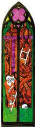
Alberola Vierge au pied de la croix

En collaboration avec le Centre National des Arts Plastiques et les ateliers des maîtres-verriers Duchemin (Paris), Parot (Dijon) et Thomas (Valence)